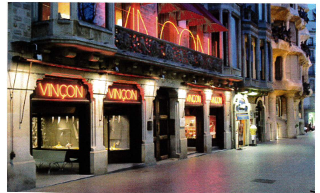
Vinçon. Passeig de Gràcia, 96. Barcelona www.vincon.com

Vinçon ha rebut importants premis al llarg de la seva trajectòria. S'ha de destacar al 1983 el trofeu Laus per la important tasca gràfica continuada, l'europeu Frankfurter Zwilling, el premi a la millor botiga de Barcelona al 1999 i el premi Nacional de Disseny que li varen concedir al 1995. En el llibre publicat amb motiu dels premis European Community Design Prize parla de "Els aparadors més suggeridors de la ciutat tractats com un regal continu que Vinçon ofereix als transeünts".